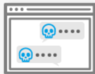
犯罪報道集約掲示板