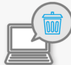
ネットから削除された情報