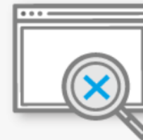
検索結果に表れない情報